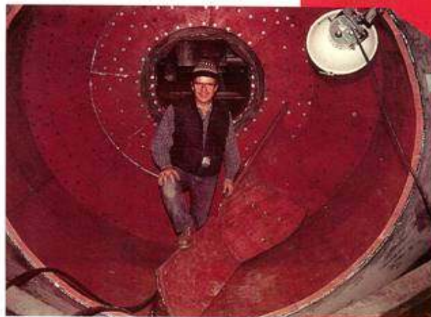
Recubrimiento de un molino alimentado por carga con Linard 60 'strapack'